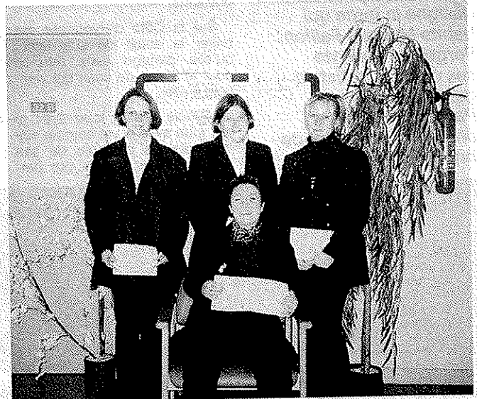
Ces cinq tudiantes du B.T.S. Score de Bonneville sont parties en croisade contre le cancer.

Contact : SCORE, 66, rue Sainte-Catherine, 74130 Bonneville, tél. 04 50 25 60 39, fax 04 50 25 63 55.