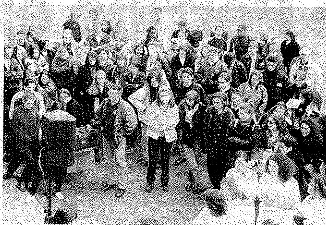
120 jeunes de 16 à 23 ans se sont à nouveau mobilisés pour ce 2e challenge, rendez-vous de la solidarité.

Tout au long de l'année, agenda en mains, ils ont géré planning, autorisations, budgets, stocks, négocié avec leurs différents partenaires et fournisseurs, médiatisé leur évé-