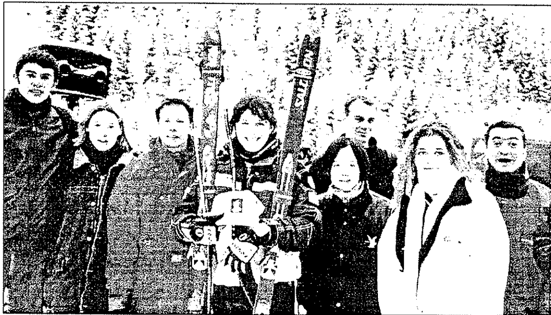
Les étudiants de Score multiplient les initiatives.

GRâce à la motivation de ces quatre équipes, les associations qu'ils avaient retenues ont eu la joie de se voir offrir un chèque de 2500 F chacune par la Caisse d'Epargne des Alpes représentée par M. Didelon et