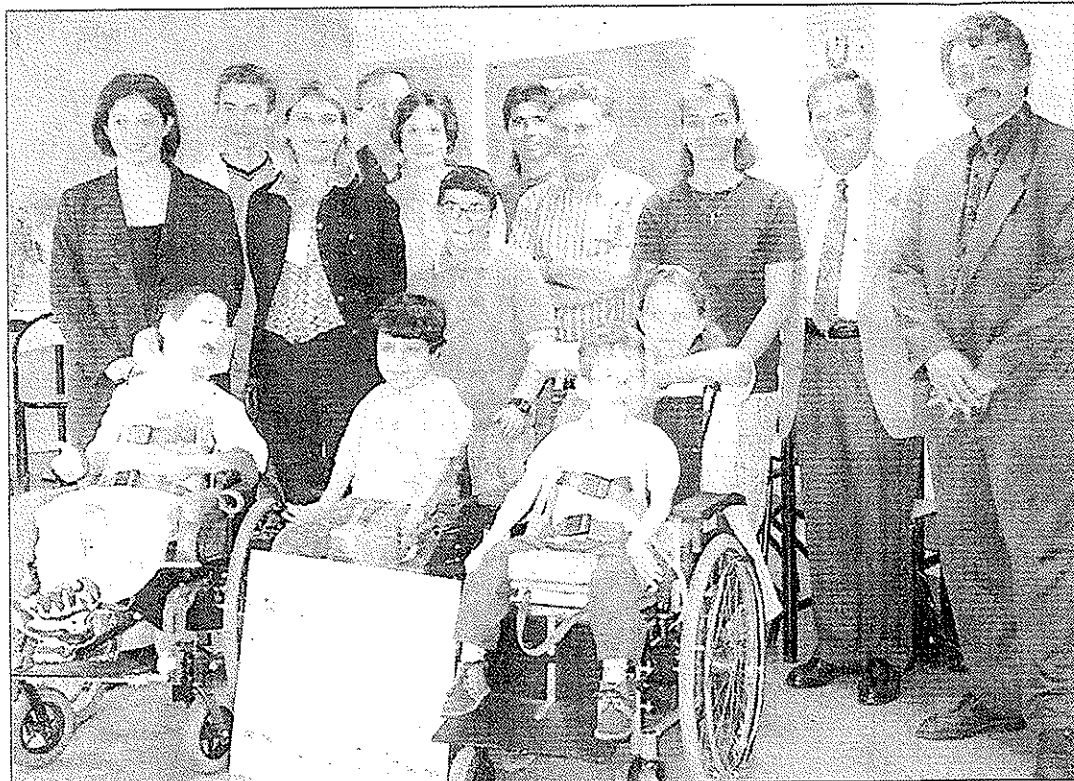
Un chèque de 5600 Frs pour l'ADIMC.

La Caisse d'Épargne des Alpes a récompensé les meilleures équipes de la région en remettant des chèques de 2500 F à chacun des projets réalisés par les lycées de