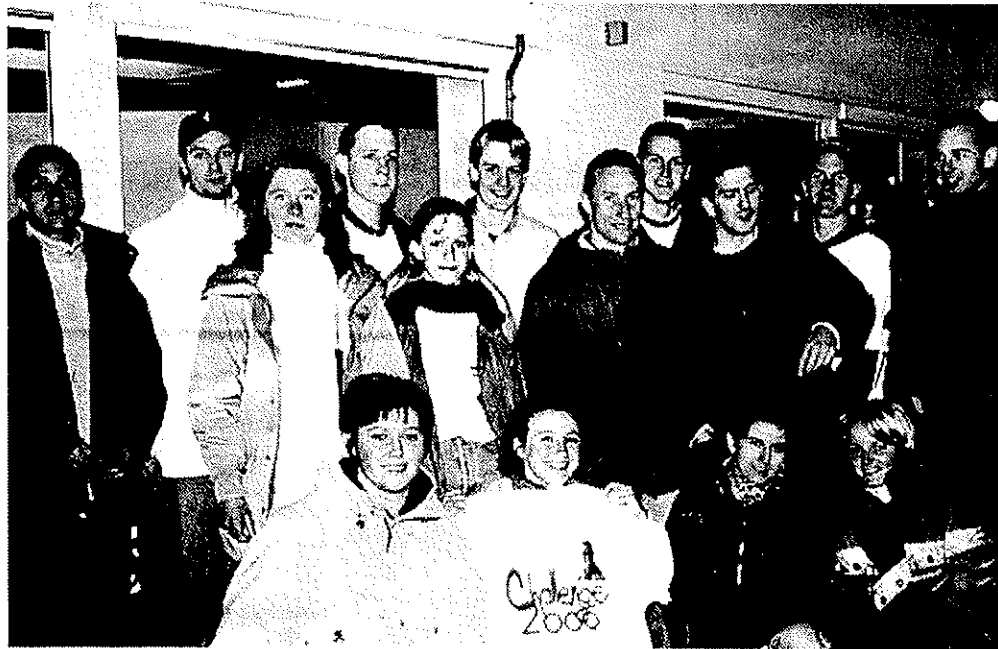
150 jeunes ont été accueillis par les étudiants de 1 re année du BTS Action commerciale.

Mardi matin dans les locaux de l'association Renouveau, qui hébergeait l'ensemble des finalistes pendant tout le séjour, se