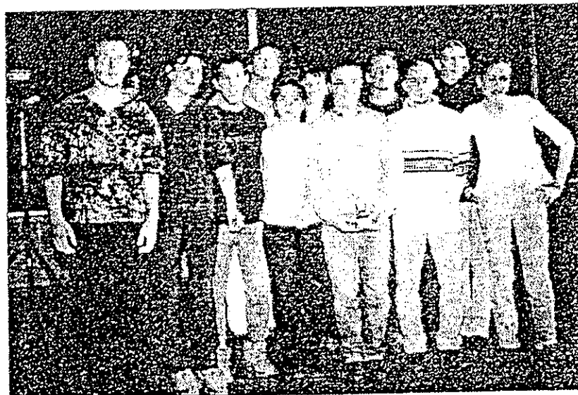
Les vainqueurs du challenge 2000 "une Idée de génie" lors de la remise des récompenses.

L' aide à l'enfance... voilà un thème à la mode, mais il ne suffit pas d'en parler, il faut agir. Et les chiffres parlent d'eux-mêmes, puisque ce sont 700 000 F qui ont été récoltés au total par les étudiants et reversés au profit d'associations humanitaires, telles que l'UNICEF, Sol en Si, SOS village enfants, Docteur clown ou encore Enfance et partage. "Ce bel exemple de solidarité, qui montre que des objectifs humains, économiques et pédagogiques peuvent se rejoindre dans un seul et