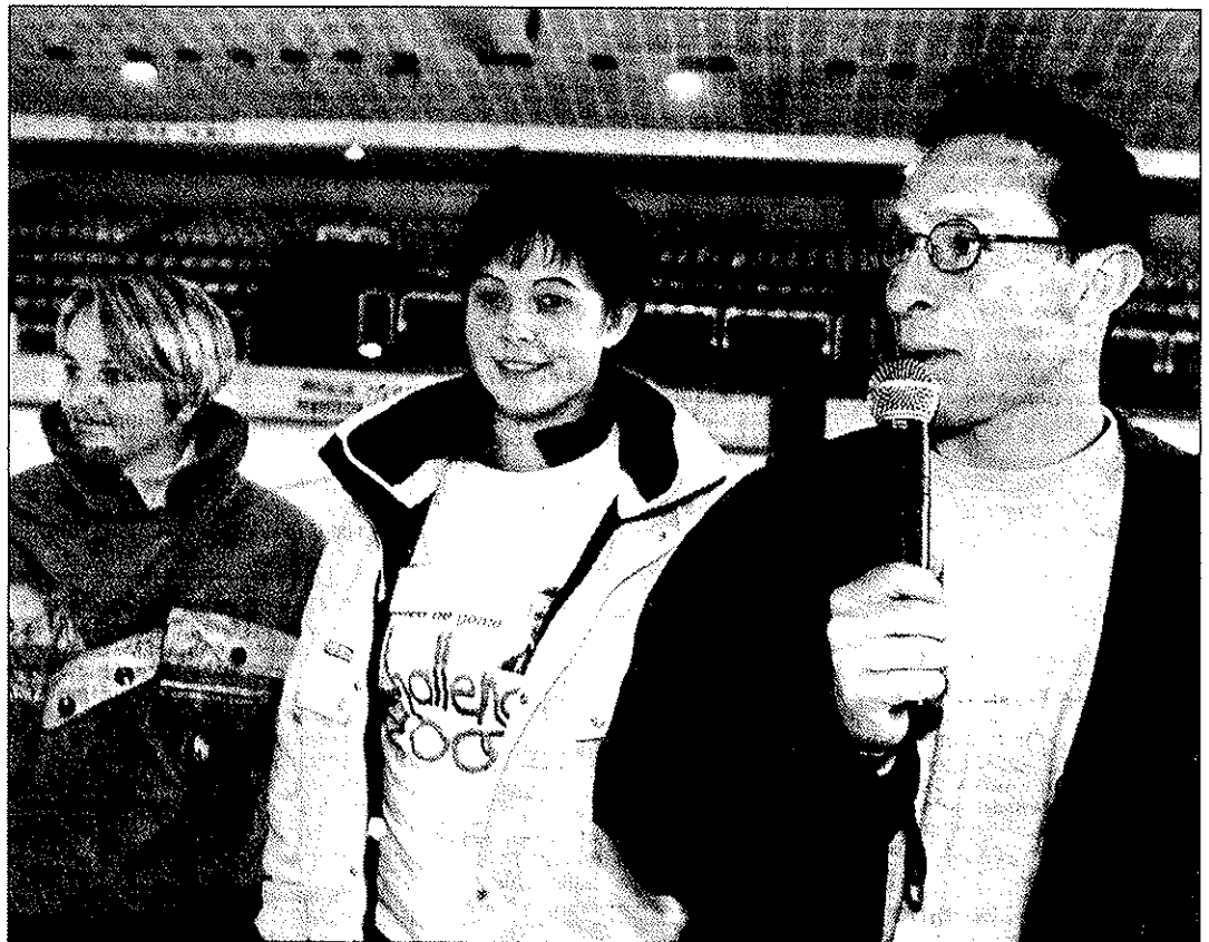
Les lauréats, organisateurs et Jean-Pierre Papin.