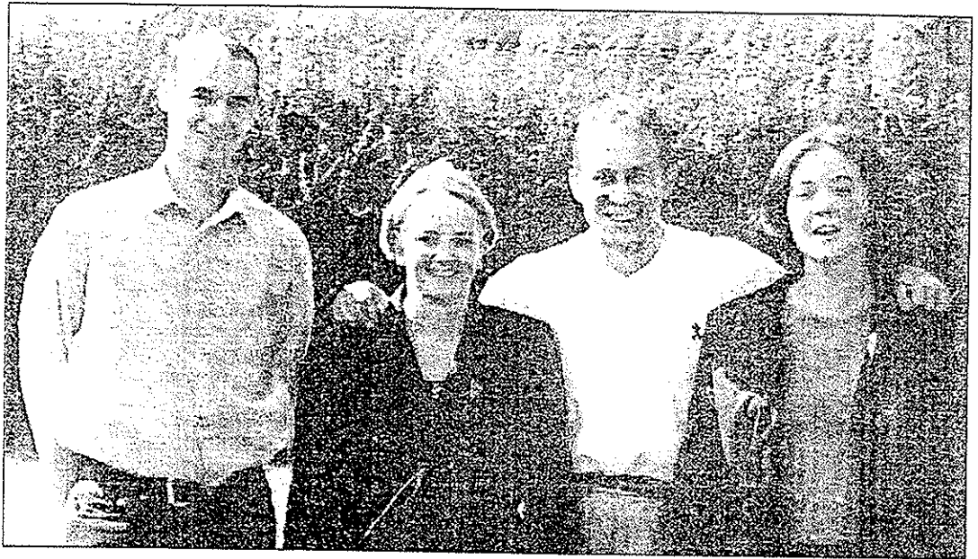
Jean-Pierre Papin parraine les actions de SCORE et plus particulièrement le challenge national "Une idée de génie".

Motivés, compétents, sérieux et dynamiques, les adjectifs ne suffisent