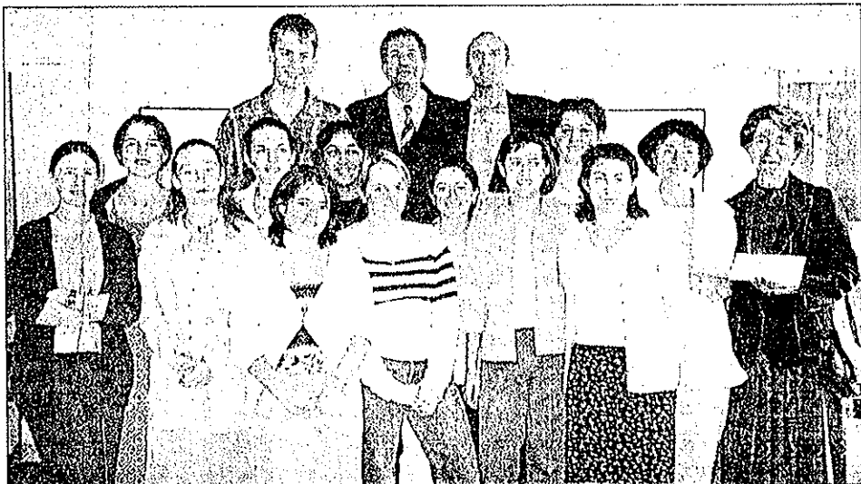
Remise des chèques de 5 000 F à l'Albec et "Enfance Majuscule".

Loin de compter leurs heures, chaque année des jeunes, anciens et nouveaux s'investissent corps et âmes, car ils savent que le temps consacré à ces actions sera bénéfique.