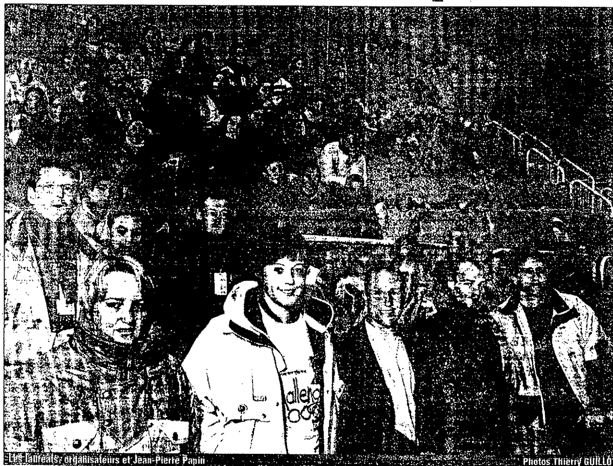
Les lauréats, organisateurs et Jean-Pierre Papin

L'ancien numéro 9 de l'équipe de France de football, parraine l'opération "Une Idée de génie" mise en musique par deux étudiantes de Bonneville. Sur la France entière des lycéens se sont mobilisés pour venir en aide aux enfants malades, handicapés, maltraités. Les lauréats se retrouvaient hier et aujourd'hui à Courchevel pour une rencontre conviviale.