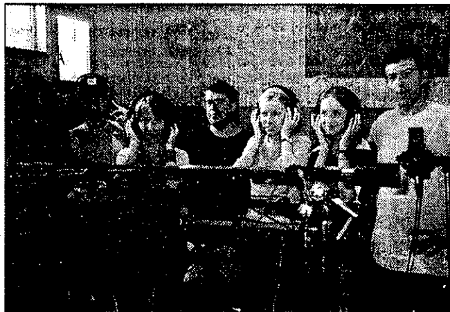
Les jeunes lors de l'enregistrement.

De nombreuses actions seront menées au profit des enfants : (L'enfant@l'hôpital et Enfance@Majuscule). Doussard intervient dans l'enregistrement d'un CD "Les loups bleus" comé-