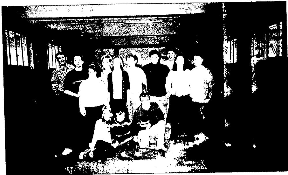
« Ce donner les moyens d'aller au bout du projet pour une bonne cause.

Les Loups Bleus, 34 jeunes bénévoles composés de 12 chanteurs et 21 danseurs d'une moyenne d'âge de 18 à 20 ans consacrent leurs loisirs à monter une comédie musicale pour les enfants malades et maltraités.