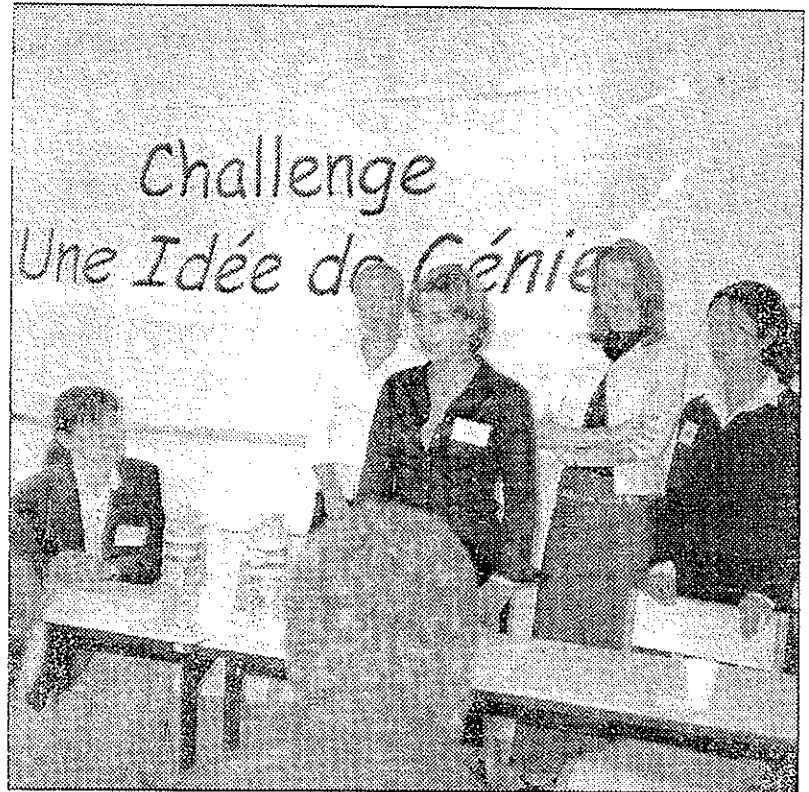
L'équipe de l'IUP qui va commercialiser "Les Loups Bleus".

"Les Loups Bleus" chanteront pour ce 6 e Challenge... Plaidoyer pour la tolérance et le respect de la différence, la comédie musicale "Les Loups Bleus" (une his-