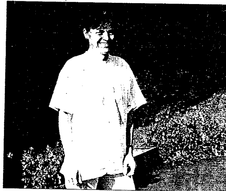
Elle préside l'association "Une idée de génie".