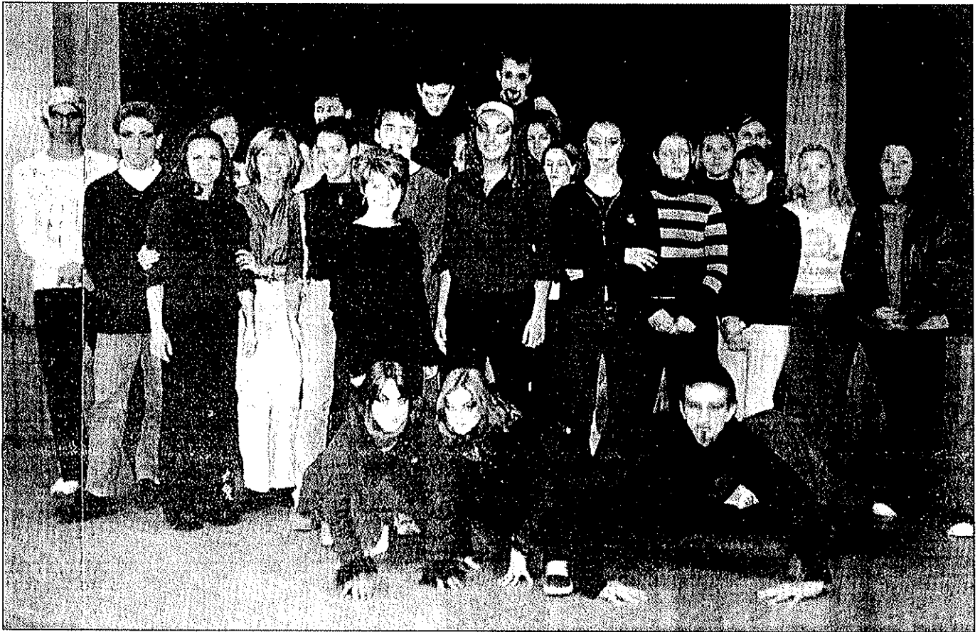
Les danseurs et chanteurs en répétition.