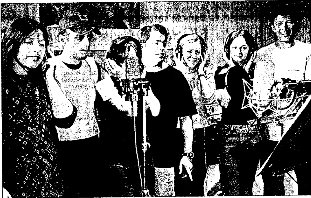
Des jeunes au grand cœur.

SOLIDARITÉ. Composée par un jeune professeur de musique haut-savoyard, enregistrée à Doussard, une comédie musicale sera diffusée dans toute la France par les jeunes... pour des associations aidant des enfants en difficulté